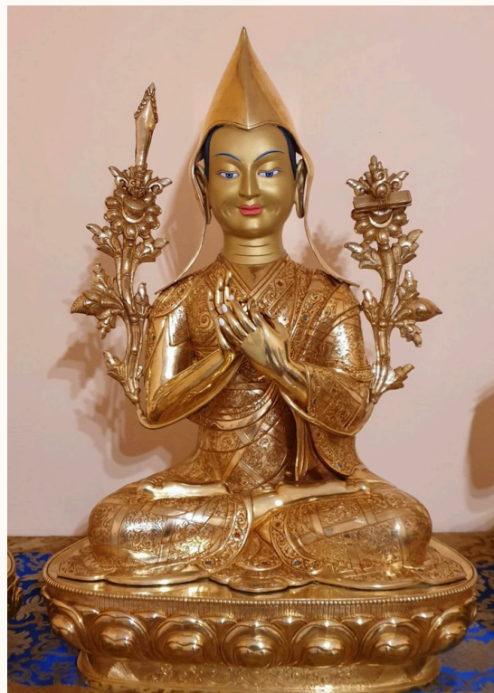
Statue de Lama Tsongkhapa à Maitreya Pure Land.

À cette occasion, nous sommes ravis d'accueillir nos frères et sœurs kalmouks , représentés par l'association ADKF (Association des Kalmouks de France), au monastère de Nalanda pendant deux jours. Ils suivent les mêmes traditions guéloug que nous, et pour eux, ce jour marque le début de la nouvelle année.